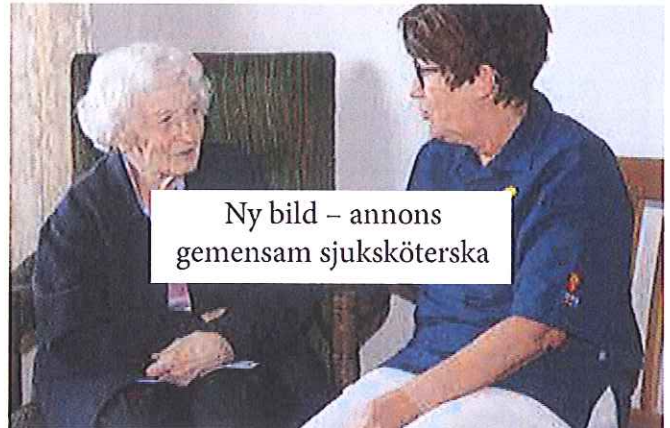
2017 ska samarbetet mellan Tibro kommun och Närhälsan i Tibro fördjupas för att förbättra och kvalitetssäkra vården till de Tibrobor som finns inom den kommunala vård- och omsorgsverksamheten. Under 2016 rekryterades en sjuksköterska som ska arbeta för både kommunen och Närhälsan med den aktuella målgruppen.

I den nationella PRIO-satsningen gällande psykiatri har Tibro varit med och gjort en inventering kring personer med komplexa psykiatriska funktionsnedsättningar samt gjort en analys och tagit fram en handlingsplan för utvecklingen av arbetet med och för denna målgrupp 2016.