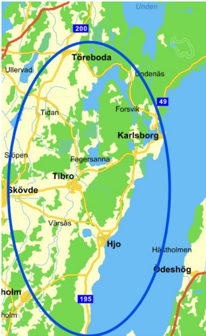
Bild 1 , Verksamhetsområde, Östra Skaraborg.

Planerat verksamhetsområde framgår av kartbild nedan, bild 1.