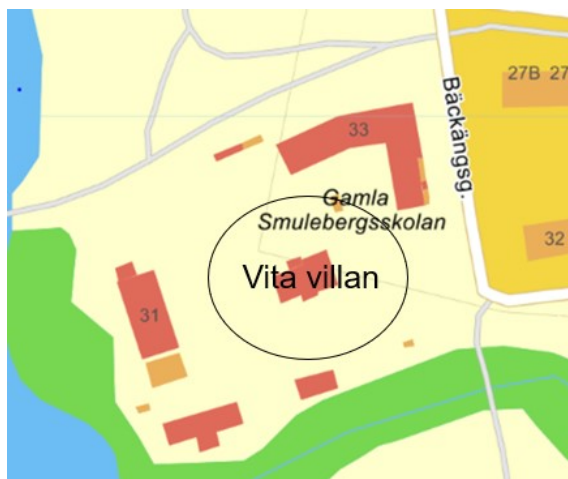
Karta över fastighet

Förhandling med försäkringsbolaget kring ersättning är slutförd och rivningen behöver av bokföringsmässiga skäl genomföras innan årsskiftet.